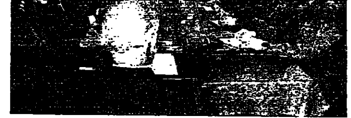
المجلس الوزاري أثناء انعقاد في الصراي امس

تمت استقالة الحكومة امس في جو هادئ ، بعد توافق مختلف الأطراف على ضرورة تقسيم مهام بين الصدر الجمهوري ورئيس الوزراء الحكومات السابقين بسبب تشكيل الوزارة الجديدة ، ويساعد على انزاسة جو التوتير السياسي كخليفة لامادة الهدوء والاستقرار الى البلاد . وقد قدم رئيس الحكومة امس استقالة حكومته لقبها الرئيس فرنجية وطلب من الوزراء استمرار في تصريف